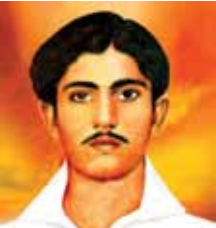
अमर शहीद हेमू कालानी

ಹೇಮು ಕಲಾನಿ ಸುಮಾರು 18 ವರ್ಷದ ಹುಡುಗ. ಸಿಂಧ್ ಪ್ರಾಂತ್ಯದ ಸುಕ್ಕೂರಿನ (ಈಗ ಪಾಕಿಸ್ತಾನದಲ್ಲಿದೆ) ಪ್ರೌಢಶಾಲೆಯಲ್ಲಿ ವ್ಯಾಸಂಗ ಮಾಡುತ್ತಿದ್ದ. ಕಿಶೋರನಾದರೂ ಸಹ ದೈಹಿಕ ಬಲಶಾಲಿಯೂ, ಧೈರ್ಯಶಾಲಿಯೂ, ಆಲೋಚನೆಯಲ್ಲಿ ಪ್ರಬುದ್ಧನೂ ಆಗಿದ್ದ.