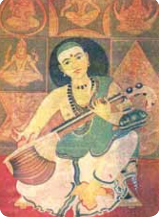
ಶ್ರೀ ಮುತ್ತುಸ್ವಾಮಿ ದೀಕ್ಷಿತರು: (1775 - 1834)

“ಎಂದರೋ ಮಹಾನುಭಾವನು, ಅಂದರಿಕ ವಂದನಮುಲು “ ಎಂಬ ಅಮೋಘವಾದ ಕೃತಿಯನ್ನು ಶ್ರೀ ತ್ಯಾಗರಾಜರು ಬಹುಷಃ ಅವರ ಸಮಕಾಲೀನರಾದಂಥಕ ಶ್ರೀ ಮುತ್ತುಸ್ವಾಮಿ ದೀಕ್ಷಿತರು ಹಾಗೂ ಶ್ರೀ ಶ್ಯಾಮಾಶಾಸ್ತ್ರಿಯವರನ್ನು ಮನಸ್ಸಿನಲ್ಲಟ್ಟುಕೊಂಡೇ ರಚಿಸಿರಬಹುದೇನೋ!! ಇಂಥಹ ಅನರ್ಘ್ಯ ರತ್ನಗಳ ಒಂದು ಕಿರು ಪರಿಚಯ.