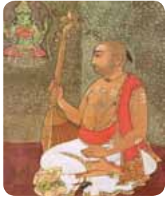
ಶ್ಯಾಮಾ ಶಾಸ್ತ್ರಿಗಳು (ಏಪ್ರಿಲ್ 26, 1762 - 1827)

ದೀಕ್ಷಿತರು ತಮ್ಮ ನವಾವರ್ಣ ಕೃತಿಗಳಲ್ಲಿ ಅವರ ಆರಾಧ್ಯದೇವತೆಯಾದಂಥಹ ಲಲಿತಾಂಜನೆಯ ಸೌಂದರ್ಯವನ್ನು ಅತಿ ಮನೋಹರವಾಗಿ ವರ್ಣಿಸಿದ್ದಾರೆ. ಇವರು ರಚಿಸಿರುವಂಥಹ ವಾತಾಪಿ ಗಣಪತಿಂ,ಶ್ರೀಕಾಂತಿಮತಿಂ, ಅಖಿಲಾಂಡೇಶ್ವರಿ ರಂಗನಾಯಕಂ, ಸೌಂದರರಾಜಂ ಆಶ್ರಯೇ, ಮಾನಸ ಗುರುಗುಹ, ಹಲವಾರು ಕೃತಿಗಳನ್ನು ನಾವು ಕೇಳುತ್ತಿದ್ದೇವೆ. ಇಂಥಹ ಮಹಾವ್ಯಕ್ತಿಯು ನರಕ ಚತುರ್ದಶಿಯೆಂದು ಜಗನ್ನಾತೆಗೆ ವಿಶೇಷ ಸೂಜೆ ಸಲ್ಲಿಸಿ, ಸಂಜೆ ತಮ್ಮ ಶಿಷ್ಯರನ್ನುಕರೆದು, ತಾವೇ ರಚಿಸಿದ ಪೋರ್ವಿಕಲ್ಯಾಣಿ ರಾಗದ “ಮೀನಾಕ್ಷಿ ಮೇಮುದಂ” ಕೃತಿಯನ್ನು ವಿಣೆಯಲ್ಲಿ ನುಡಿಸುತ್ತಾ, ಆ ಜಗನ್ನಾತೆಯ ಮಡಿಲಿನಲ್ಲಿ ಅಲನವಾದರು.